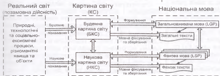
Рисунок 1. Картина світу та її формування, мовне фіксування і зберігання

(рис. 1). Буденне пізнання – це пізнання світу в процесі буденного життя, тоді як наукове пізнання – це цілеспрямоване вивчення світу в цілому або окремих його об'єктів за допомогою спеціальних емпіричних та теоретичних методів. Відповідно результатом пізнання є картина світу (КС) – загальні знання про світ, його будову, типи об'єктів та їхні взаємозв'язки, що існують у свідомості певної спільноти на конкретному етапі її історії та лежать в основі світобачення людини [26, с. 204; 27, с. 44]. КС, як і будь-яка модель, спрощуючи і схематизуючи дійсність, виділяє з нескінченного розмаїття реального світу саме ті його об'єкти та сутнісні зв'язки між ними, пізнати які й становить основну мету на тому чи іншому етапі історичного розвитку.